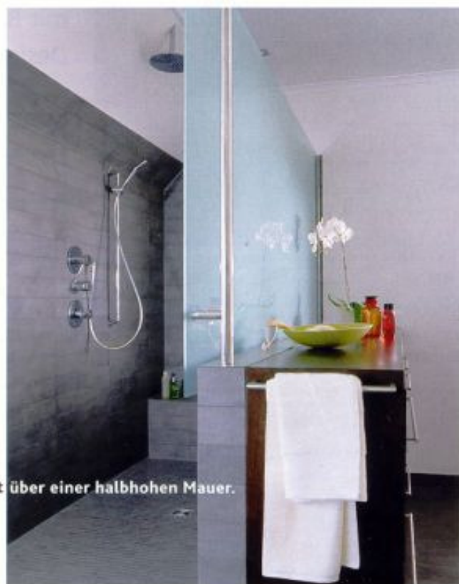
FAMILIENDUSCHE mit Bank. Die Abtrennung schwebt über einer halbhohen Mauer.