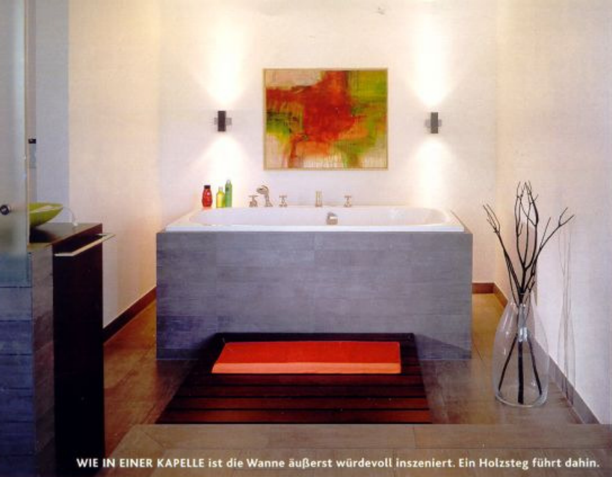
WIE IN EINER KAPELLE ist die Wanne äußerst würdevoll inszeniert. Ein Holzsteg führt dahin.

Wenn Karin Klugstedt in ihrem silberfarbenen Kombi über Land fährt, könnte man denken, die junge Frau ziehe um. Aus dem Kofferraum lugen ein Lampenschirm und die Beine eines Tischchens. Auf dem Rücksitz stapeln sich Vorhänge. Aber der Schein trügt, hier ist eine professionelle Planerin unterwegs, die Menschen zu ihren Traumwohnungen, Traumbädern und was noch verhilft – jedenfalls dann, wenn das Nest gebaut oder gekauft ist und nach der bestmöglichen Rauminszenierung gefragt wird. Die Wege zur Verwirklichung von Träumen sind im Zweifelsfall ziemlich weit auf dem flachen Land, hier an der holländischen Grenze. Deshalb bietet Karin Klugstedt mehr als nur den Raumentwurf. Das hat sich herumgesprochen, bis nach Südlohn im westlichen Münsterland, wo Christian und Daniela Westhoff mitten in den Planungen für ihr Haus steckten. Vor allem das Bad sollte etwas Besonderes werden – ein bisschen exotisch vielleicht, dabei →