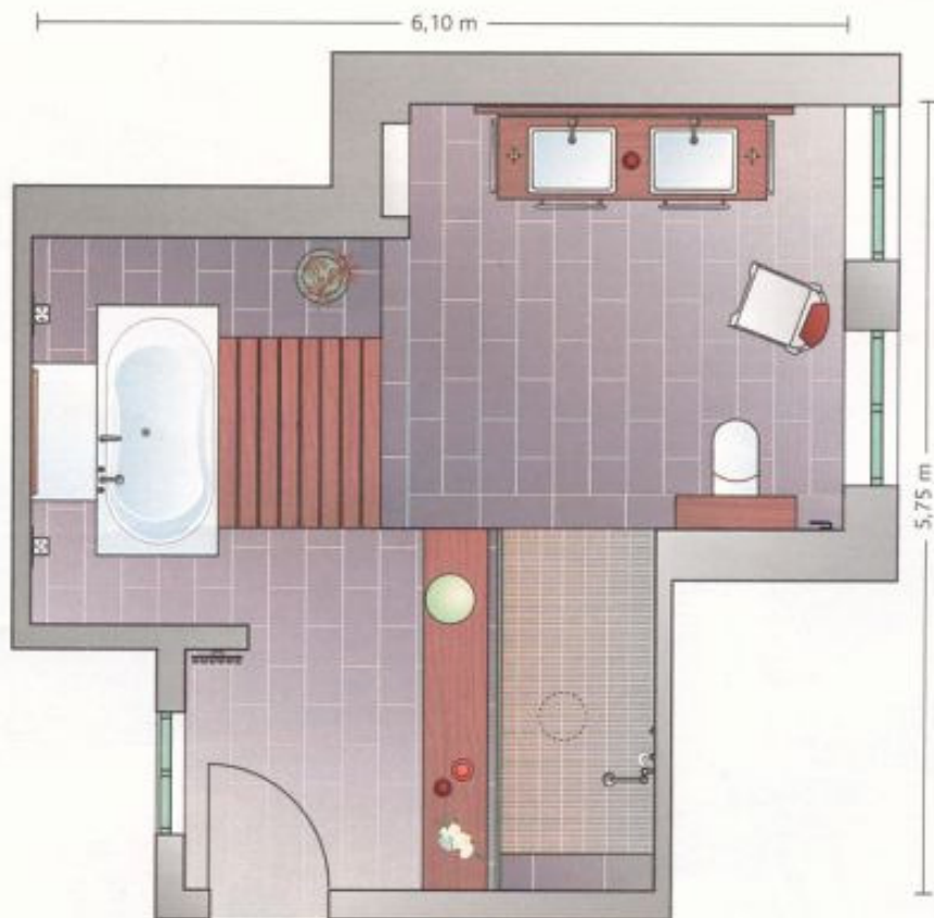
VIEL BEWEGUNGSRaum bietet das Bad zwischen seinen Funktionsbereichen.